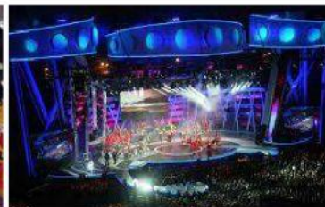
Festival de Viña del mar