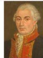
Mateo de Toro y Zambrano