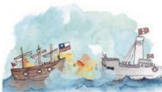
Combate Naval de Iquique