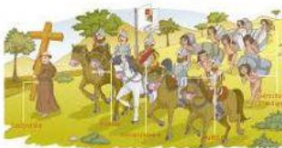
Conquista de América