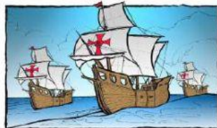
Descubrimiento de América

II. Une con una línea el hito que se conmemora con el personaje destacado (2 ptos. c/u- 8 ptos. total).