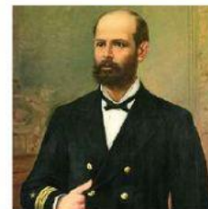
Arturo Prat Chacón