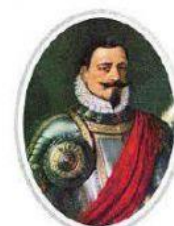
Pedro de Valdivia