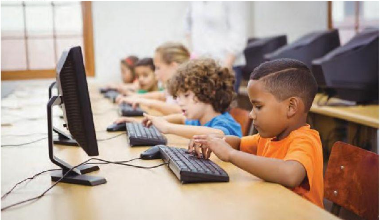
Niños accediendo a la información por medio de la tecnología

Según la guía, los niños tienen derecho a usar Internet para informarse y expresar sus ideas, pero también deben ser responsables y recibir la orientación de sus padres y maestros para evitar ser víctimas de delincuentes.