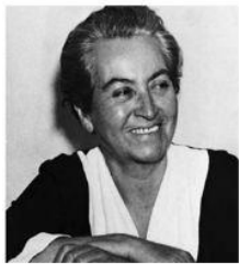
Gabriela Mistral Escritora Chile