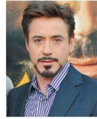
Robert Downey Jr. Actor Estados Unidos