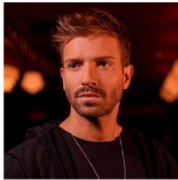
Pablo Alborán Cantante España