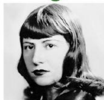
María Luisa Bombal Escritora Chilena