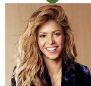
Shakira colombiana Cantante