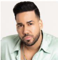
Romeo Santos Cantante República Dominicana