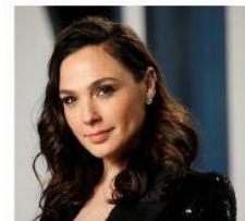
Gal Gadot Actriz Israel