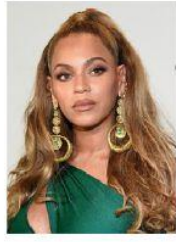
Beyoncé Cantante Estados Unidos