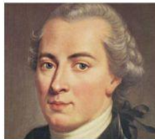
Immanuel Kant Filósofo Alemania