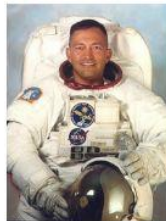
Carlos Noriega Astronauta Peru