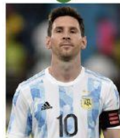
Lionel Messi argentino Futbolista