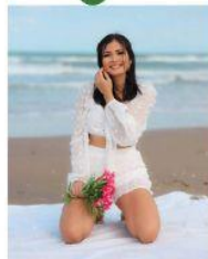
Bessy Cantarero Rego youtuber hondureña