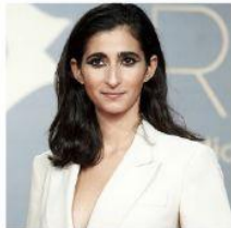
Alba Flores Actriz España