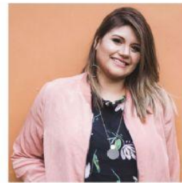
Marcela Gándara Cantante México