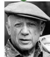
Pablo Picasso español Pintor