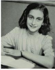
Ana Frank (Anne Frank) niña escritora Alemania