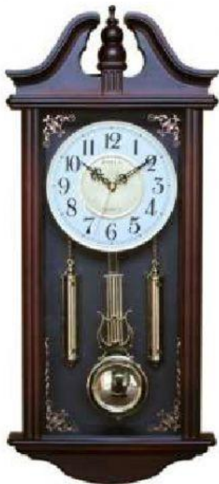
e) Relógio de Pêndulo (1.655)