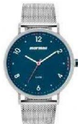
f) Relógio de Pulso (1.868)