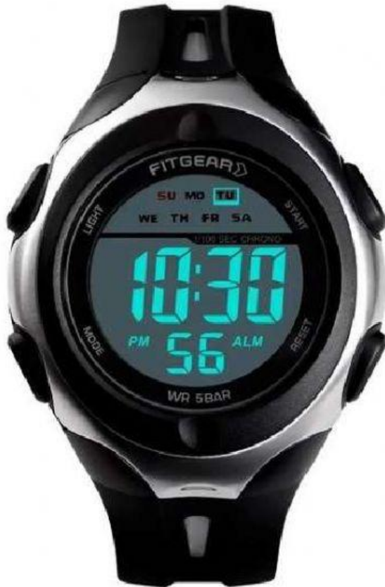
g) Relógio Digital (1961)