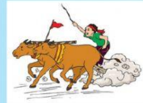
JOKI KARAPAN SAPI