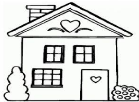
Nhà mặt đất

Câu 2: Ngôi nhà của các con có những phòng gì nhỉ?