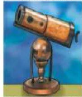
Telescopio construido por Isaac Newton

Telescopio reflector construido con espejos y lentes.