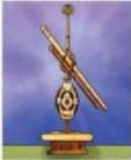
Telescopio construido por Galileo Galilei

Une cada telescopio con sus características.