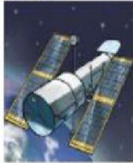
Telescopio espacial Hubble

Utilizado ahora por la NASA para tomar fotografías espaciales.