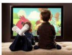
regarder la télé