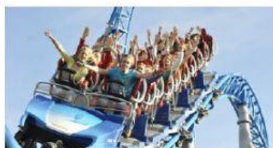
faire du manège