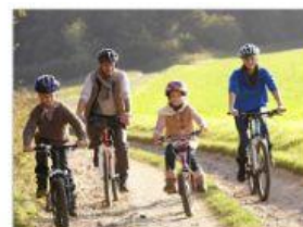
faire du vélo