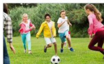
jouer au foot