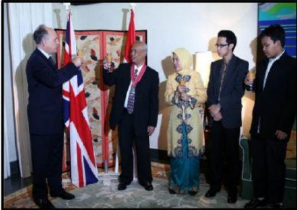
(Azyumardi Azra, orang Indonesia pertama yang menerima gelar kebangsawanan "Sir" dari Ratu Elizabeth II.)