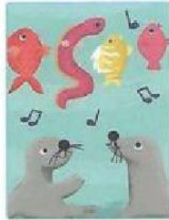
Ana y sus amigas enseñando un baile a las focas.