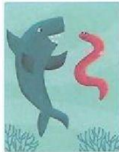
Ana conversando con un tiburón.