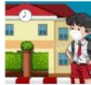
datang ke sekolah jam 08:00