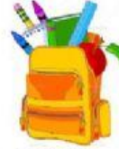
membawa alat tulis