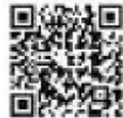
ข้อมูลยี่ราฟ

คำชี้แจง ตอนที่ 2 ให้นักเรียนบอกชื่ออาหารของยีราฟมา 5 ชนิด และนำพยัญชนะภาษาอังกฤษมาเติมลงในช่องว่างให้ถูกต้อง (ข้อละ 10 คะแนน) รวม 50 คะแนน