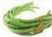
G. Long bean