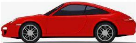
校車 xiào chē