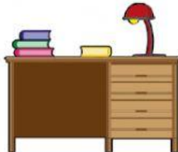
Un espacio para estudiar