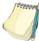
Cuaderno de apuntes y lápiz