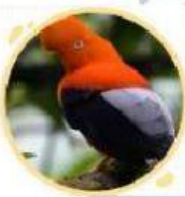
Gallito de las rocas