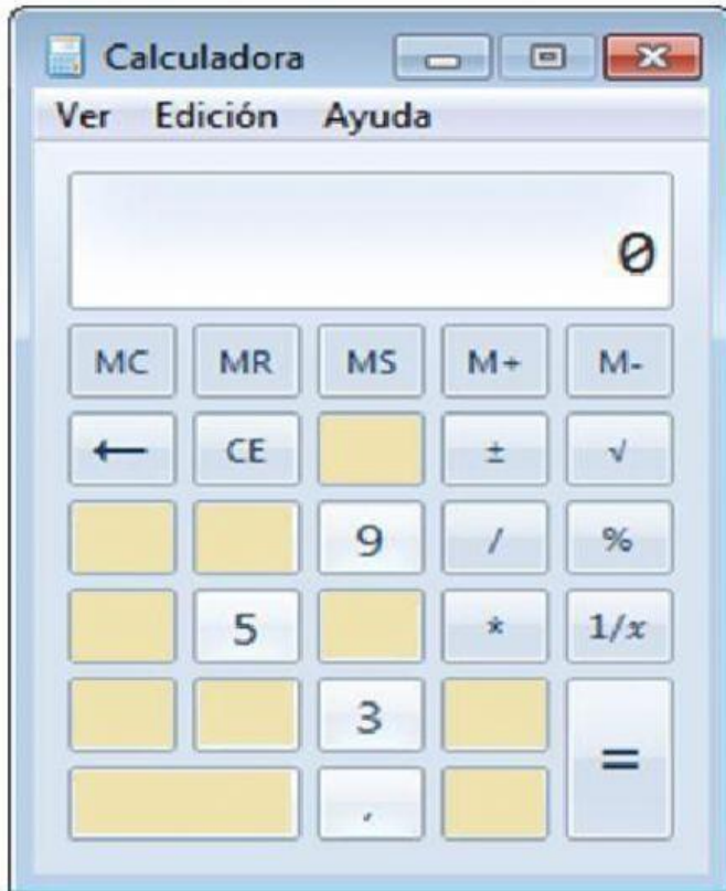
Imagen de guía

1.- Completar la siguiente calculadora según corresponda, observa la imagen de guía.