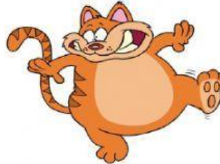
El gato Garfield