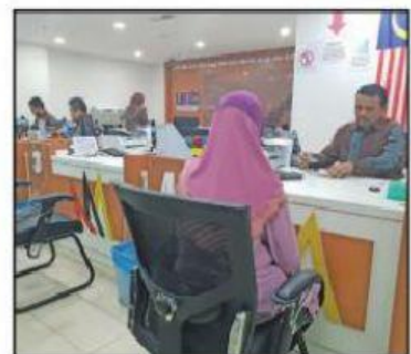
Berkhidmat untuk negara dengan jujur dan amanah.