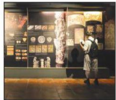
Melawat muzium dan membaca buku sejarah.