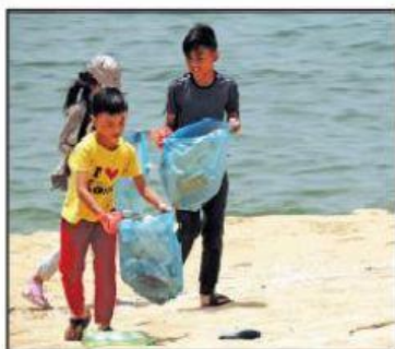
Menjaga kebersihan dan persekitaran dengan tidak melakukan pencemaran.