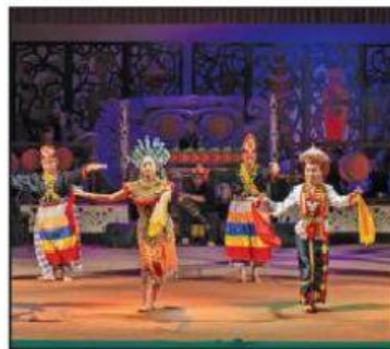
Memelihara budaya dan warisan negeri.