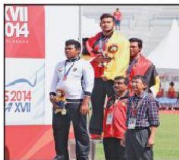
Mengharumkan nama negeri melalui acara sukan, pertandingan dan sebagainya.