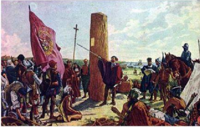
Segunda fundación de Buenos Aires por Juan de Garay en 1580

Para la creación de las ciudades, elegían el sitio, buscaban nombre y patrón, preparaban la ciudad e instalaban un puñado de colonos previamente seleccionados.