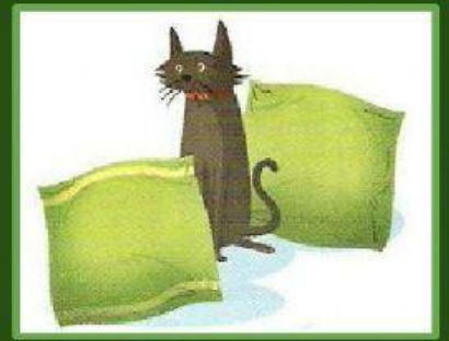
ENTRE ELS COIXINS .....