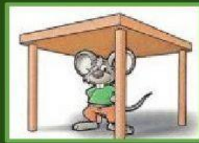
SOTA LA TAULA .....