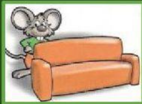
DARRERA DEL SOFÀ .....