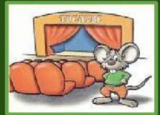
AL TEATRE .....