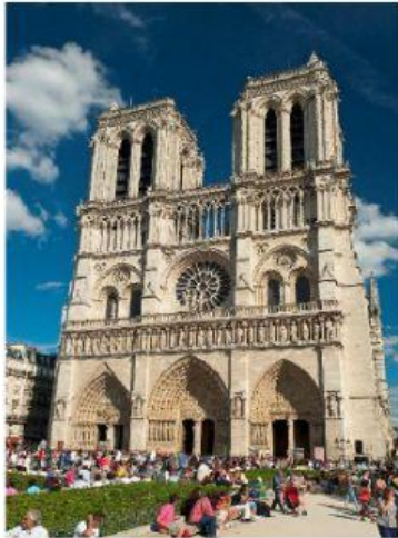
Notre Dame de Paris