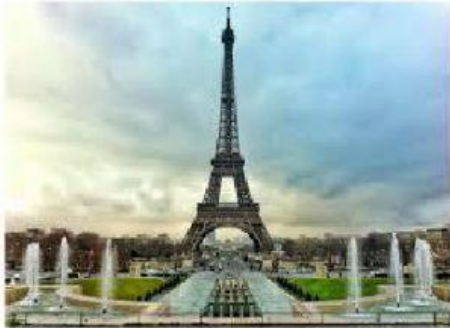
La Tour Eiffel

Dans quels arrondissements de Paris se trouvent ces monuments?