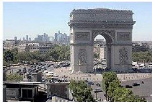
La place Charles-de-Gaulle, aussi appelée la place de l'Étoile