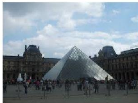
La Pyramide du Louvre