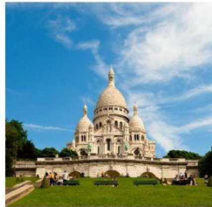
La basilique du Sacré-Cœur de Montmartre