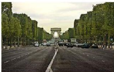
Avenue des Champs-Élysées