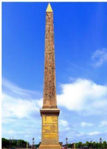
L'Obélisque de la place de la Concorde