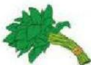
1 ikat bayam Rp1.000,00