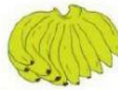
1 sisir pisang Rp5.000,00