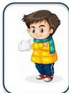
No pasar frío