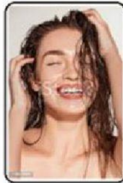
Secar pelo mojado