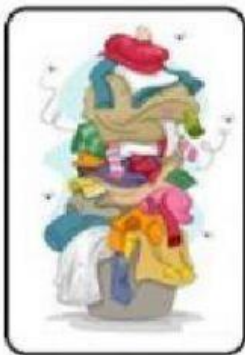
Lavar ropa sucia

Indica que objeto tecnológico soluciona cada situación que nos podemos encontrar diariamente