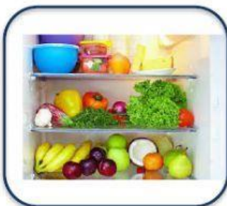
Guardar alimentos frescos