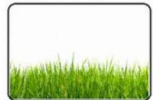
Cortar el pasto