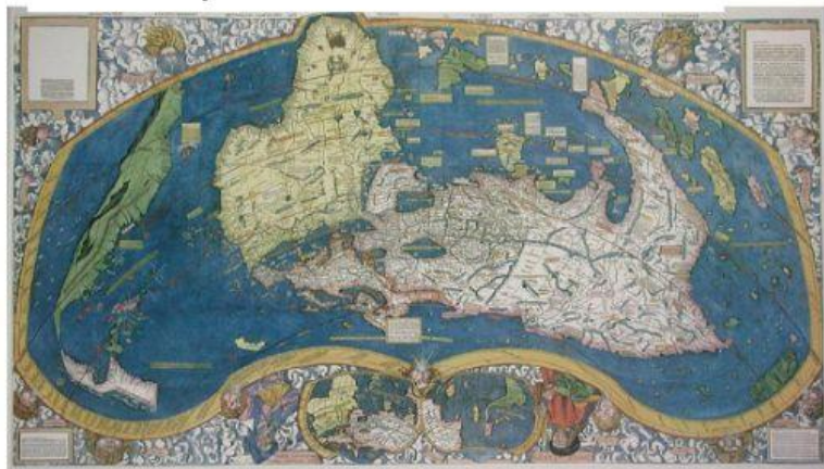
Mapa de Martin Waldseemüller