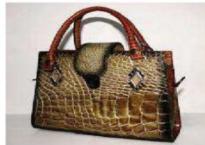
Memanfaatkan sebagai bahan kerajinan

B. Kerjakan Soal-Soal dibawah ini dengan tepat!