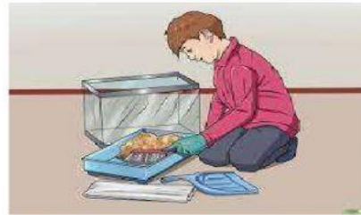
Menjaga Kebersihan Kandang Hewan Peliharaan