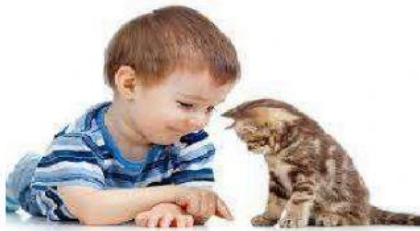
Bermain dengan hewan peliharaan

A. Pilihlah jawaban Hak terhadap Hewan atau Kewajiban terhadap Hewan dari gambar-gambar berikut!