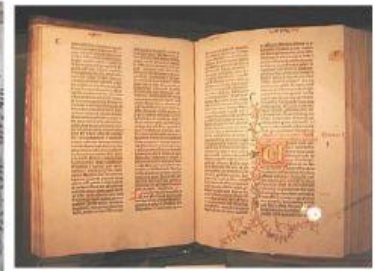
Biblia de 42 líneas – 300 EJEMPLARES