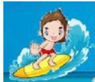
faire du surf