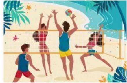
Jouer au volley