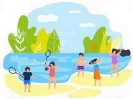
Jouer aux raquettes