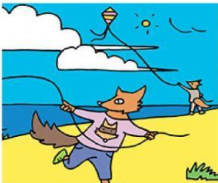
Jouer au cerf-volant