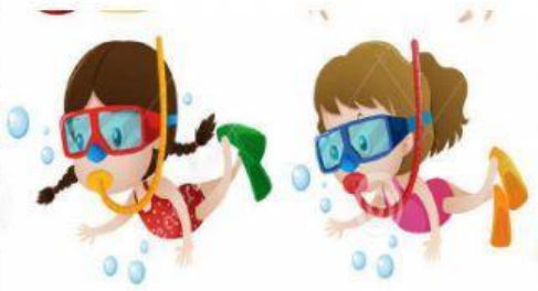
faire de la plongée