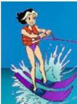
faire du ski nautique