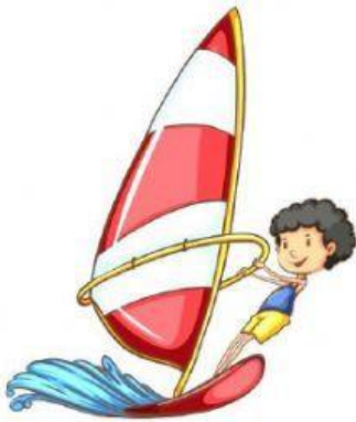
faire de la voile