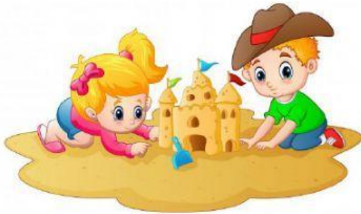
Jouer au sable