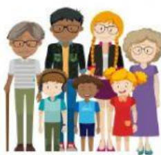
The Family (a família)

3- Ajude a Família a chegar à casa marcando o caminho certo!!!