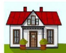
The House (a casa)