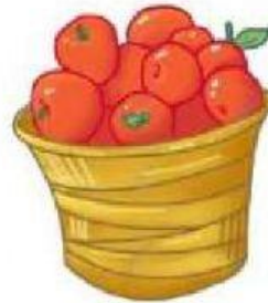
Tomat 375 kg