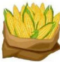
Jagung 550 kg