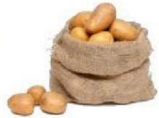
Kentang 570 kg