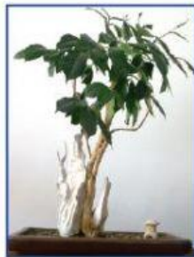
La planta del cafeto