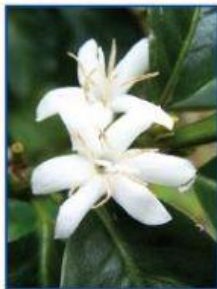
La flor del cafeto

Los cafetos son arbustos con tallos que miden dos o tres metros de altura. Tienen hojas perennes, de un bonito color verde brillante; que crecen en pares opuestos a lo largo del tallo. Las flores blancas, con un delicioso aroma de jazmín, se agrupan en la base de las hojas, formando glomérulos florales de ocho a quince flores. Los frutos que son verdes primero, demoran entre ocho y doce meses en madurar, y van pasando del amarillo al rojo escarlata. Por eso, estos frutos reciben a veces el nombre de cerezas.