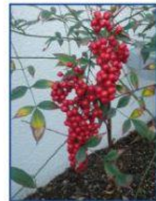
El grano de cafeto