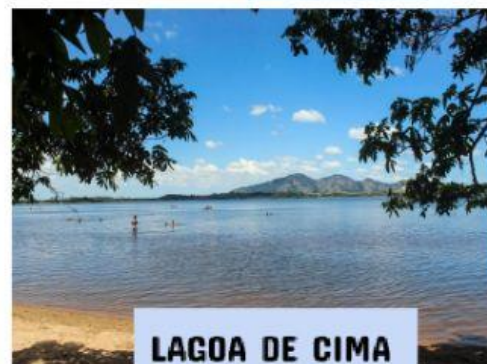
LAGOA DE CIMA