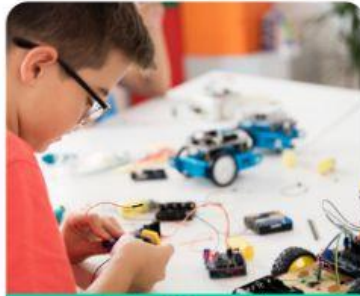
ประดิษฐ์