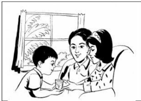
วัฒนธรรมครอบครัว