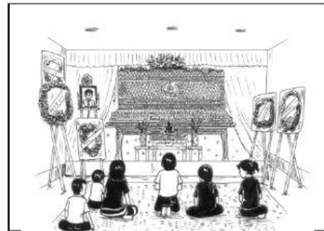
วัฒนธรรมครอบครัว