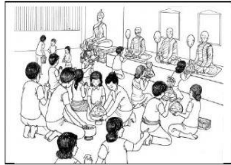
วัฒนธรรมครอบครัว