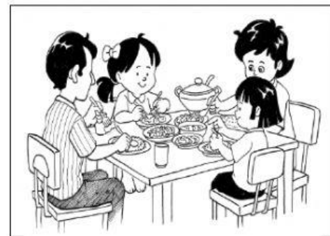
วัฒนธรรมครอบครัว