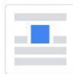
Intercalado en el texto

2) Completa el nombre de los estilos que faltan.