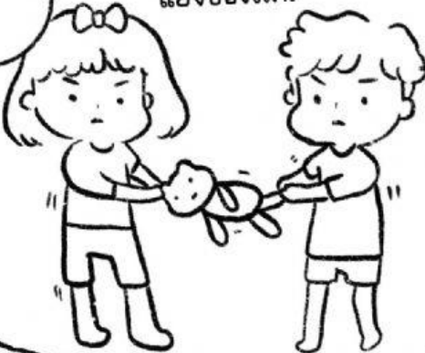
แย่งของเล่น