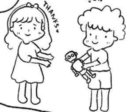
แบ่งสิ่งของให้ผู้อื่น