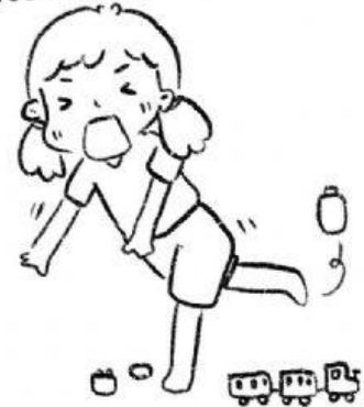
วางของไว้บนพื้นจนผู้อื่นมาสะดุด