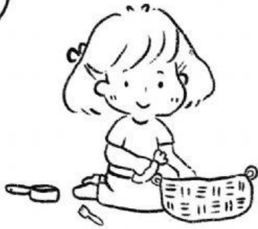
เก็บของเข้าที่เมื่อเลิกใช้งาน