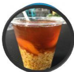
MOTE CON HUESILLO