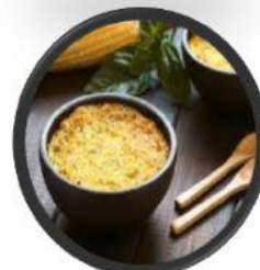
PASTEL DE CHOCLO