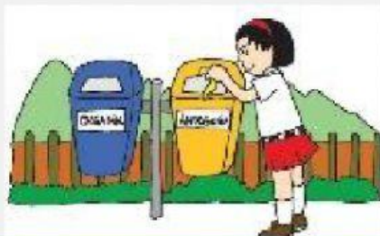
Tidak membuang sampah disungai