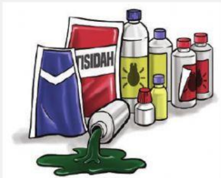
Tidak menggunakan pestisida untuk tumbuhan