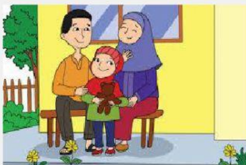
Gambar 3 Memperoleh kasih sayang