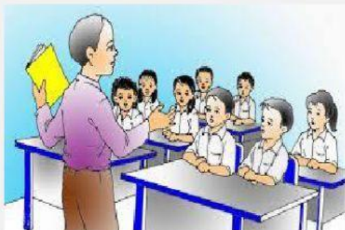
Gambar 1 Bersekolah