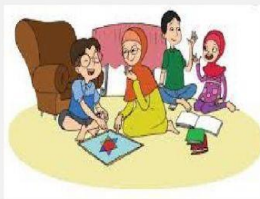
Gambar 2 Belajar