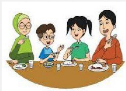
Gambar 2 Makan