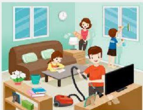
Gambar 1 Membantu Orangtua