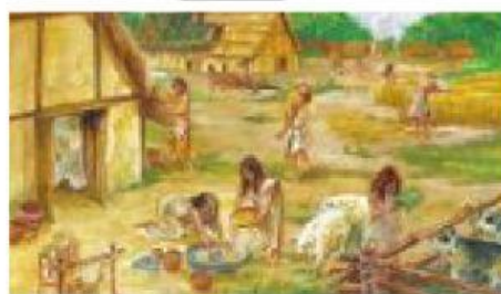
ESPECIALIZAÇÃO DO TRABALHO