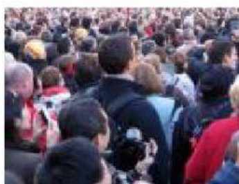
AUMENTO DA POPULAÇÃO