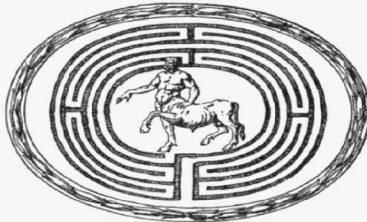
FIG. 40.—Labyrinth engraved on an ancient gem. (Maffei.)

Un día, Dédalo e Ícaro miraban al cielo, contemplando a las aves que volaban libremente.