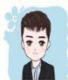
gē ge 哥哥

tīng tīng kàn shuō shuō kàn bīng gōu chū de jiā rén 聽聽看、說說看，並勾出 CB 的家人。 Listen and speak the family members in Chinese. And then check the boxes which are CB's family.