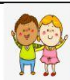
péng yǒu 朋友