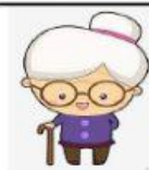
nǎi nai 奶奶