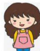
mā ma 媽媽