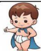
dī dī 弟弟