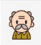
yē ye 爺爺