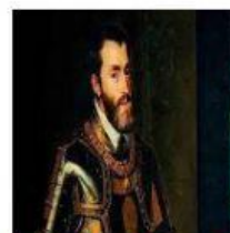
Rey de España