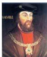
Rey de Portugal

b.- Selecciona al rey que financió o ayudó a Magallanes.