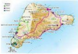
Isla de Pascua

c.- ¿Cuál era el destino principal del viaje de Hernando de Magallanes? Hace un click en la respuesta correcta.