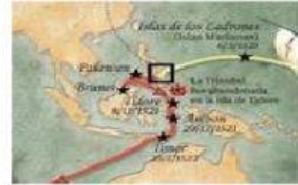
Las islas Molucas

d.- ¿Cuánto barcos utilizo en este viaje? Hace un click en la cifra correcta.