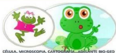
CÉLULA, MICROSCOPIA, CARTOGRAFÍA...¡ADELANTE BIO-GEO!