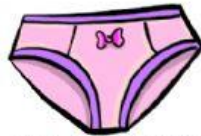
los calzoncillos las bragas