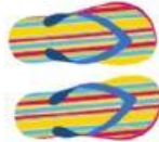
LAS CHANCLAS/ LAS CHANCLETAS