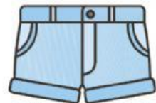
EL SHORT/ EL PANTALÓN CORTO