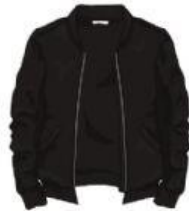
LA CHAQUETA/ LA CHAMARRA