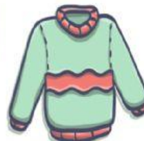
EL SUÉTER/ SUDADERA/ CHANDAL