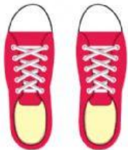
LOS TENIS/ LAS ZAPATILLAS DEPORTIVAS