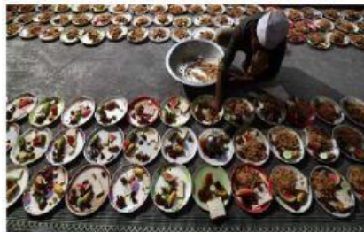
MES EN EL QUE LOS MUSULMANES AYUNAN PARA CONMEMORAR LA PRIMERA REVELACIÓN DEL PROFETA