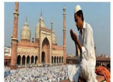
SEGUIDORES DE ALÁ