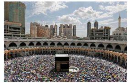
LUGAR DONDE NACIÓ EL PROFETA Y ES LUGAR DE PEREGRINACIÓN