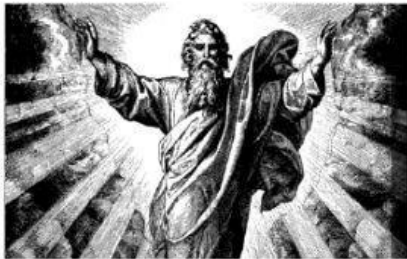
NOMBRE DEL DIOS DE LOS MUSULMANES