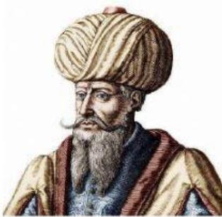
NOMBRE DEL PROFETA