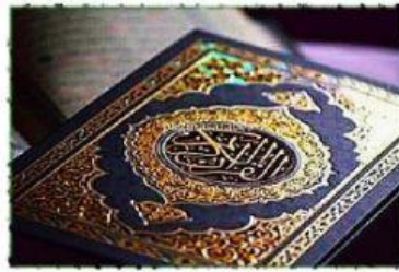
LIBRO SAGRADO PARA LA RELIGIÓN ISLÁMICA