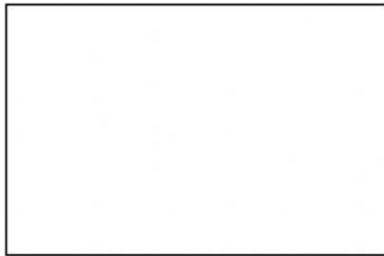
ภาพถ่ายภายนอกที่พักอาศัยของนักเรียน