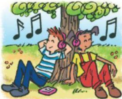
écouter de la musique