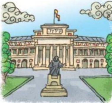
le musée du Prado