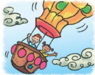
monter en ballon