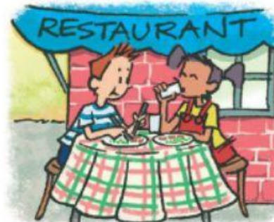
manger au restaurant