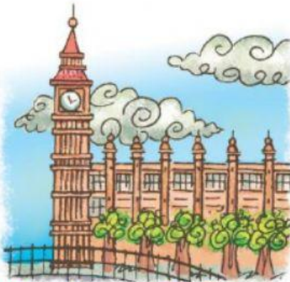
l'horloge « Big Ben »