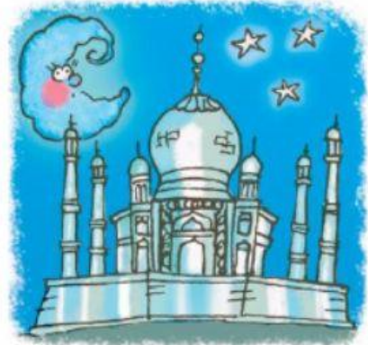
le Taj Mahal