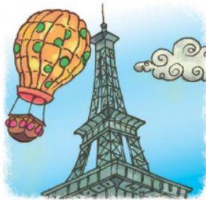
la tour Eiffel