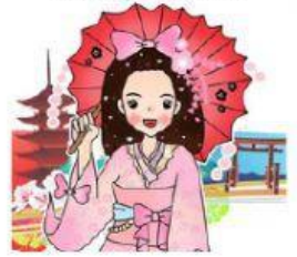
Illustration by LOOK SENGEI