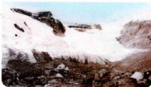
Nevado Broggi antes de 1979.