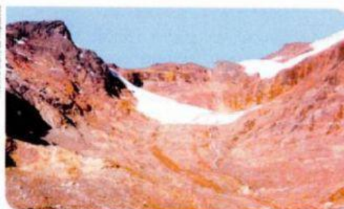
Nevado Broggi en 2005.