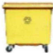
ENVASES, PLÁSTICO, ETC.